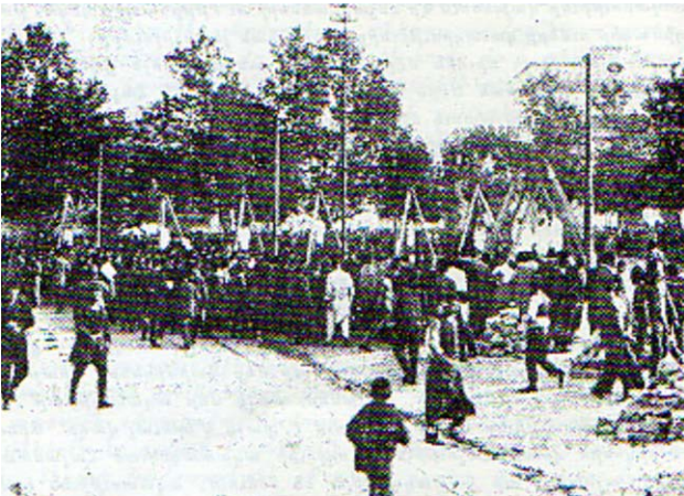
Քսաններու կախաղանուը Պայապիտի հրապարակին վրայ:

մը, հայ գիտութեան եւ մշակույթի անկման իրավիճակը...»