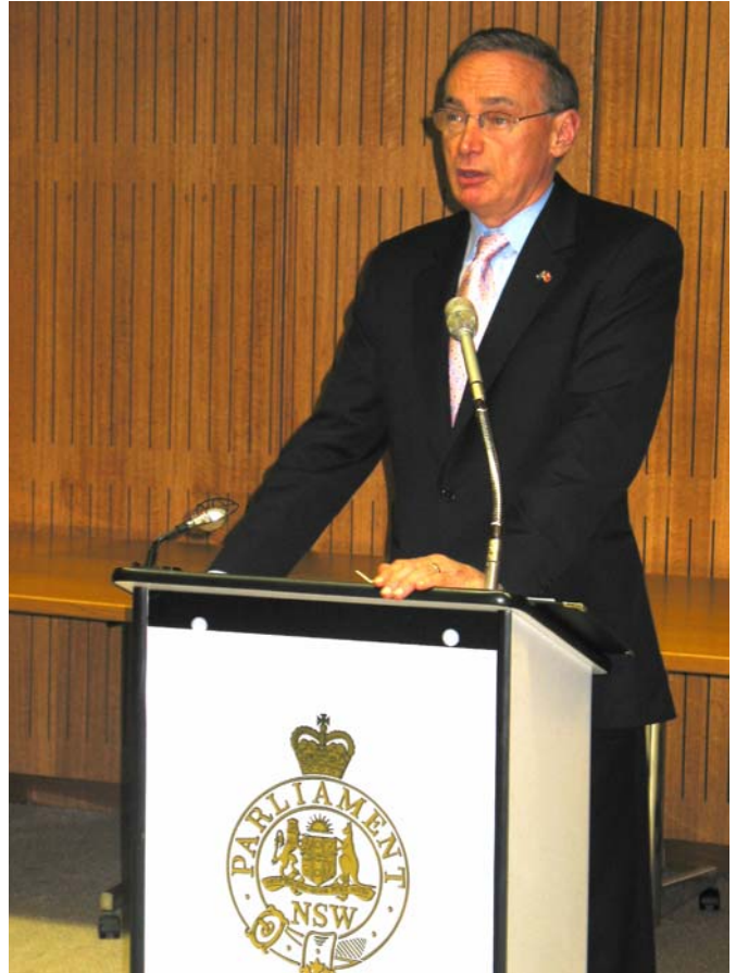
Premier Carr addressing the Armenian community representatives and NSW Parliamentarians

"I hope the NSW Armenian Parliamentary Friendship group will help further strengthen relations with NSW and the Republic of Armenia, including stronger trade relations and closer cultural collaboration," Mr Carr said.