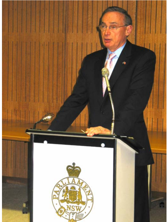
Premier Carr addressing the Armenian community representatives and NSW Parliamentarians

"I hope the NSW Armenian Parliamentary Friendship group will help further strengthen relations with NSW and the Republic of Armenia, including stronger trade relations and closer cultural collaboration," Mr Carr said.